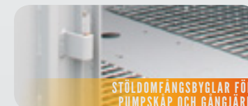
STÖLDMFÅNGSBYGLAR FÖR PUMPSKÅP OCH GÅNGJÄRN

KORROSIONSMÅLAD INVÄNDIGT PÅ GOLVET SAMT 1/3 UPP PÅ VÄGGARNA