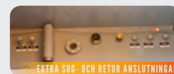
EXTRA SUG- OCH RETUR ANSLUTNINGAR