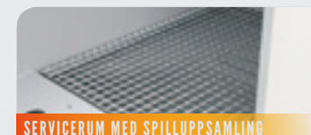
SERVICERUM MED SPILLUPPSAMLING