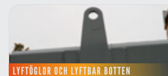
LYFTÖGLOR OCH LYFTBAR BOTTEN